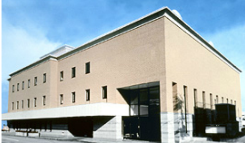
小樽市民センター